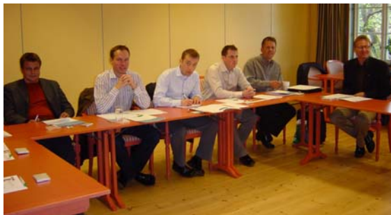
Upptaktsseminarium i Tällberg för deltagarna i Telémachos

Skillnaden är den här gången att adepterna är män och mentorerna kvinnor. Med siktet inställt på mer jämställdhet och mer genusperspektiv är detta ett projekt i framkanten. Flera erfarenheter i starten visar, att det finns föreställningar om hur ett mentorprogram SKA se ut, som förvånar ledningen för projektet. Projektet utvärderas kontinuerligt under resans gång och kommer att bli en spännande rapport nästa år.