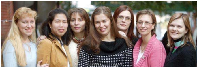
Deltagarna i "Maria 4" presenteras närmare i broschyren

I mars avslutades det fjärde Mariaprojektet under trevliga former vid en lunch. Deltagarna har under ett år deltagit i seminarier, gjort praktik, arbetat eller studerat. Alla adepter har haft en mentor inom sitt yrkesområde vilket är ovärderligt för bransch-kunskapen och utvecklingen av yrkesspråket. Vid projektets slut hade fyra deltagare heltidsanställning och tre deltidsarbete av de tio. Flera av deltagarna kommer fortsättningsvis att studera på högskola. De flesta har läst behörighetsgivande kurser på Komvux parallellt med arbete/praktik.