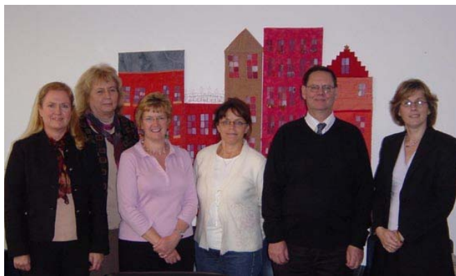
Möte i partnerskapet "Hackers for Equality i Bryssel söndagen den 30 oktober.

Tillsammans ska Inverness, Dalarna och Slovenien bl.a. arbeta med tillväxtfaktorer regionalt.