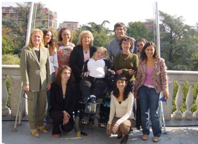
Partnerskapets möte i Modena 13-14 oktober

"A Private matter" har partners i Sydeuropa och handlar om hur man på olika sätt ska få sitt yrkesliv att gå ihop med privatlivet. Det kan ju vara en utmaning i Italien där förskolan öppnar kl 8 på morgonen och har stängt tre månader på sommaren, jullov och påsklov. Dessutom får ingen familj med farmor, mormor eller annan kvinnlig släkting i närheten någon plats till sina barn. Kvinnorna förväntas lösa den situationen på egen hand. Gender School ska i projektet bl a bidra med sk svenska sociala modellen, men också genuskunskap och att till delprojekten i Gender School finna nya infallsvinklar från de spanska, franska och italienska partnerskapet.