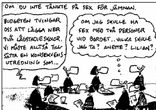
Införd i Svenska Dagbladet, 3 april 2005. Illustratör: Jan Berglin.

Vidare; vi fortsätter att söka mer information i stället för att ta itu med åtgärder. Flickorna och kvinnorna förväntas anpassa sig. Nu kräver fler och fler att männen ska delta och förändras, utvecklas. Tyvärr finns det fortfarande män som tror att det ska gå över – mardrömmen – det otäcka faktum att många kvinnor är lika bra eller till och med bättre än männen inom en rad områden.